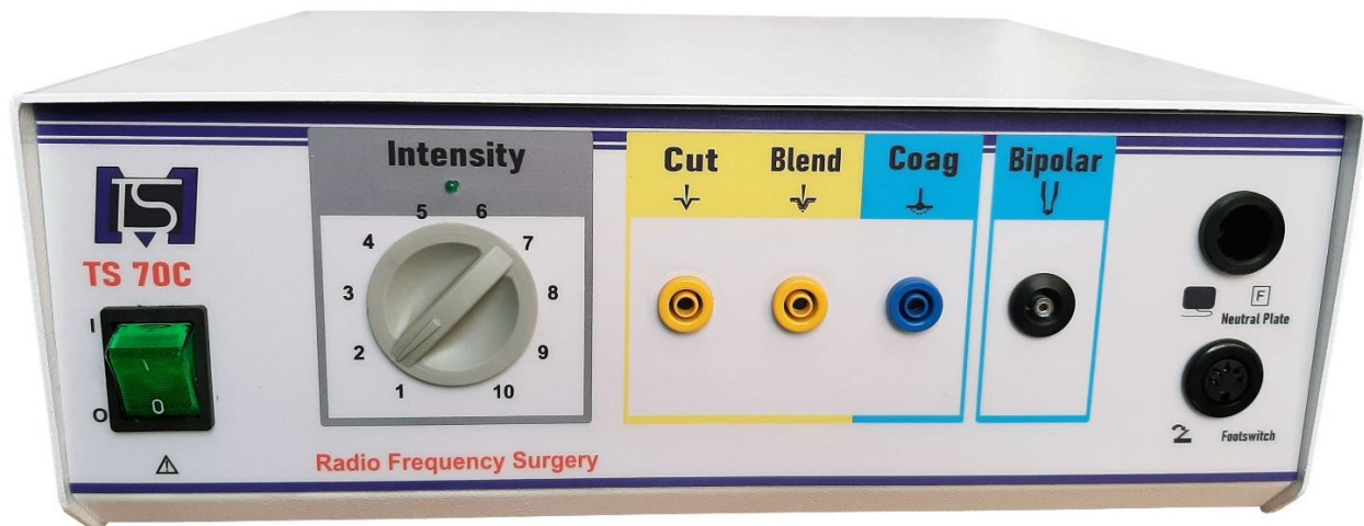
Model : TS 70C